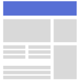
BILLBOARD TKP: 15 EURO

Wer auf Würzburg Erleben unterwegs ist, schaut genau hin: auf Bilder, auf Stories – und auf Ihre Anzeige. Unsere Displayflächen erscheinen direkt dort, wo Menschen über die neuesten Nachrichten informieren oder re-gionale Events entdecken.