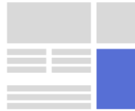
HALFPAGE AD TKP: 15 EURO