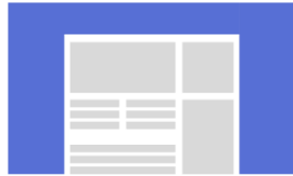
FIREPLACE TKP: 17.5 EURO