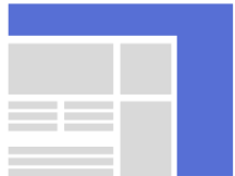
WALLPAPER TKP: 12.5 EURO