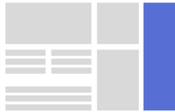
SKYSCRAPER TKP: 7.5 EURO