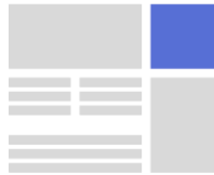
RECTANGLE TKP: 7.5 EURO