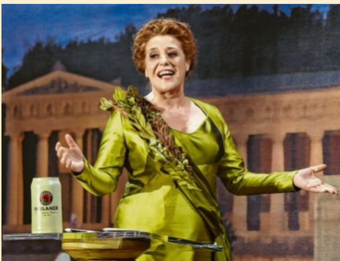
Die als „Mama Bavaria“ vom Nockherberg bekannte Luise Kinseher gibt in diesem Jahr ein Gastspiel auf der Scherenburg.

Leichtfüßiger kommt die Abenteuer-Komödie „In 80 Tagen um die Welt“ daher. Die Adaption des Jules-Verne-Romans erzählt die Geschichte des Unternehmers Phileas Fogg, der wettet, mit einem exakten Zeitplan und den „modernen“ Transportmöglichkeiten des 19. Jahrhunderts in 80 Tagen einmal die Erde umrunden zu können.