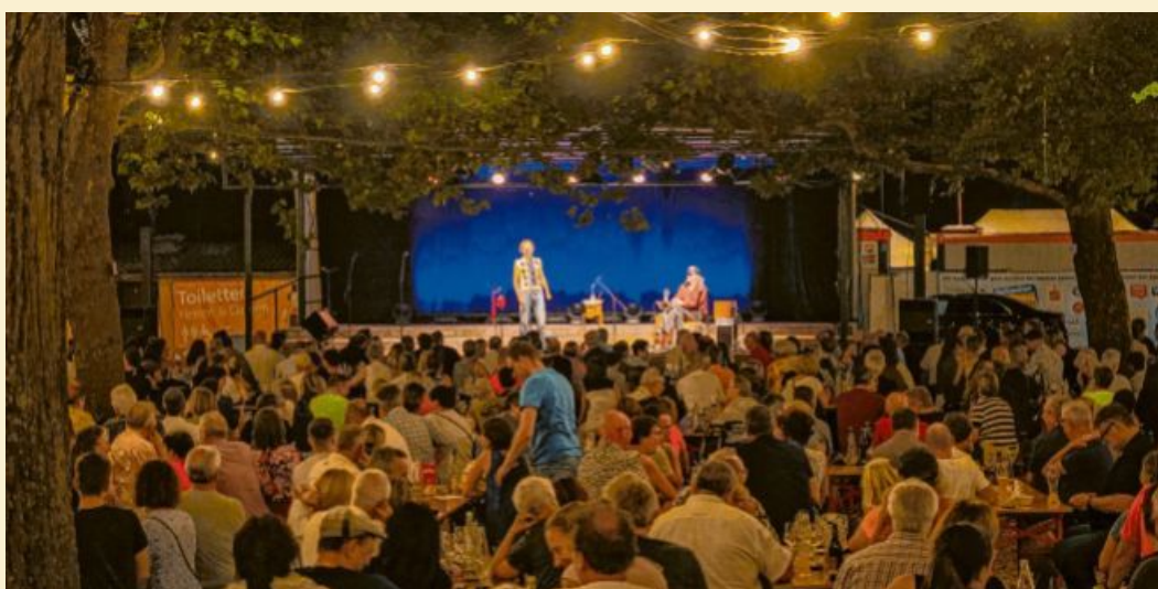
Beim Volkacher Kabarett Sommer ist immer einiges los, wie hier bei Olaf Schubert.