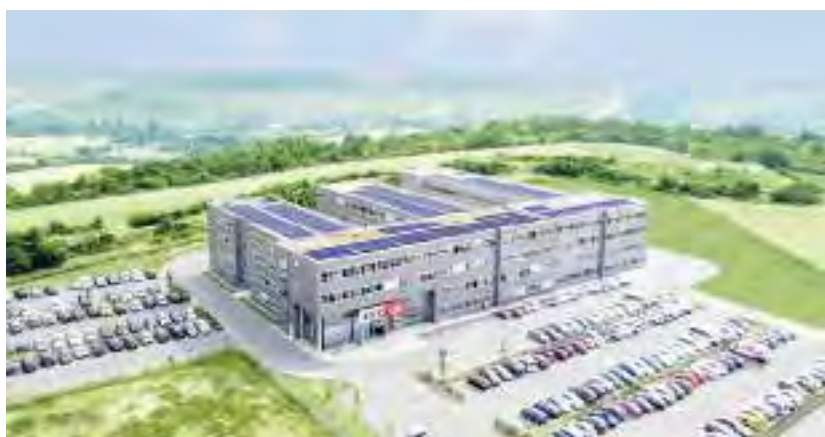
In der Deutschlandzentrale arbeiten rund 700 Menschen.

Egal, welche Qualifikation: Wer gerne im XXXLutz-Team mitarbeiten und die Karriereleiter erklimmen will, meldet sich im neuen Karrierecenter unter karriere.xxxlutz.de . Hier gibt es reichlich Informationen über die zahlreichen Karrierechancen bei XXXLutz in Mainfranken.