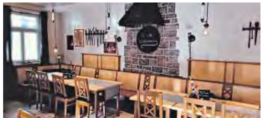
Bis zu 70 Gäste finden hier Platz und Gastfreundlichkeit.

Tische können Sie ganz bequem auch online buchen. Weiteres auf alteschmiede-dettelbach.de .