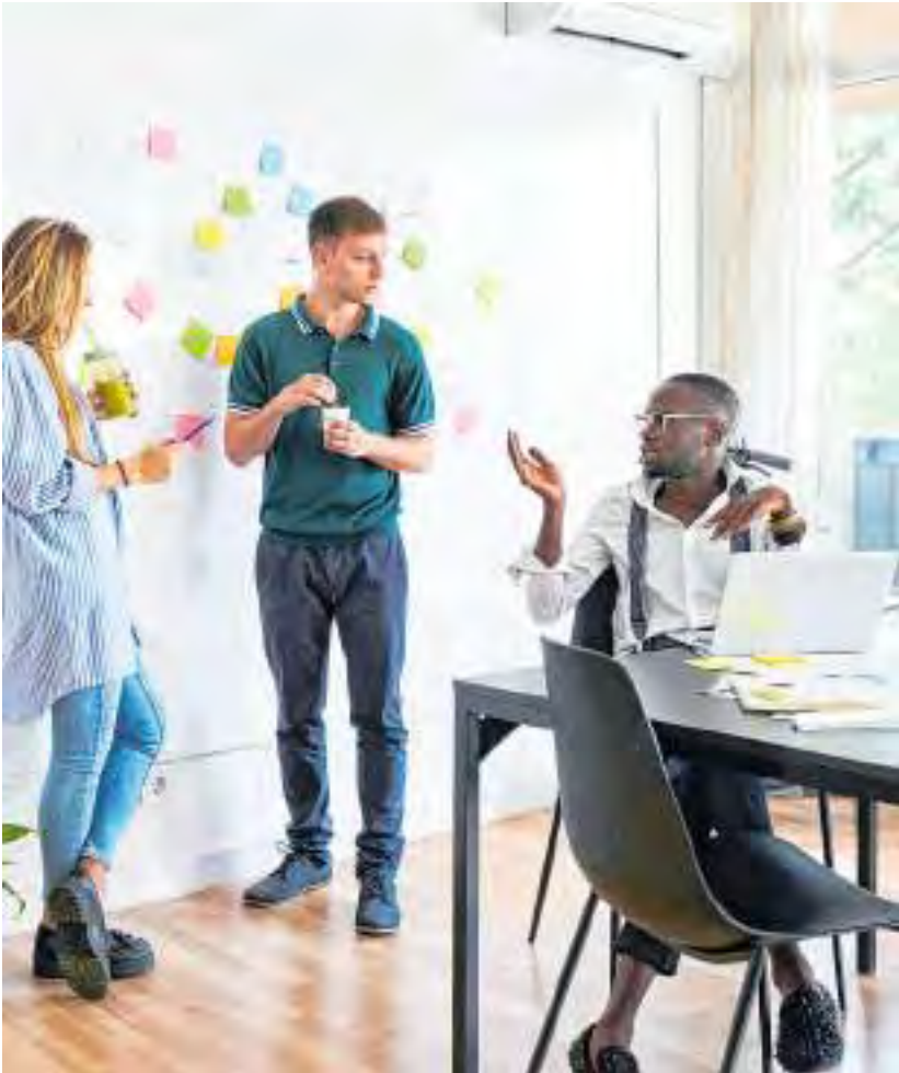
Wer als junger Mensch ein Unternehmen gründen möchte, braucht nicht nur gute Ideen, sondern auch Business-Wissen (Symbolbild). „Wirtschaft@School“ soll diese Gruppe für das Unternehmertum begeistern.