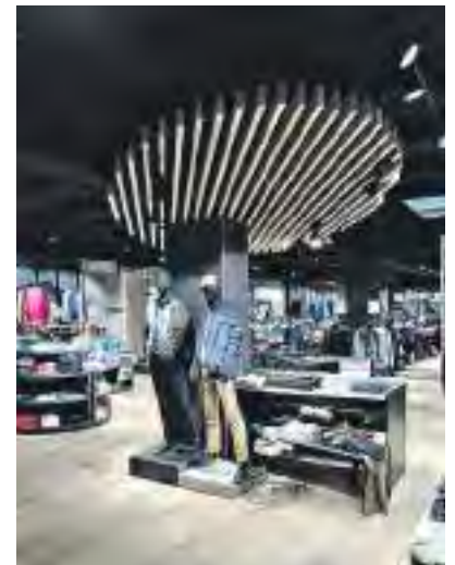
Modehaus Koch in Karlstadt: großzügige Verkaufsflächen

mit großzügigen Verkaufsflächen, Bereichen zum Verweilen und einer Bar. So macht es einfach Spaß, sich in jeder Saison von aktuellen Trends inspirieren zu lassen. Dazu kommt eine sehr große Markenvielfalt, die die Auswahl durch geschulte, stilischere Berater und Beraterinnen vor Ort erleichtert und das Einkaufen zu einem wahren Vergnügen werden lässt. Da kommen Kunden gerne wieder.