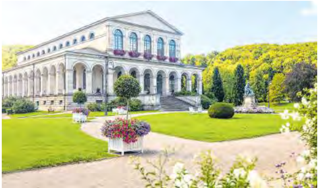
Das Kursaalgebäude in Bad Brückenau

„Der Landkreis Bad Kissingen ist ein lebenswerter Landkreis – attraktiver Gesundheits-, Tourismus- und Kulturstandort, nachhaltiger Wirtschafts- und Arbeitsstandort, innovationsstark und auf Zukunftsthe-