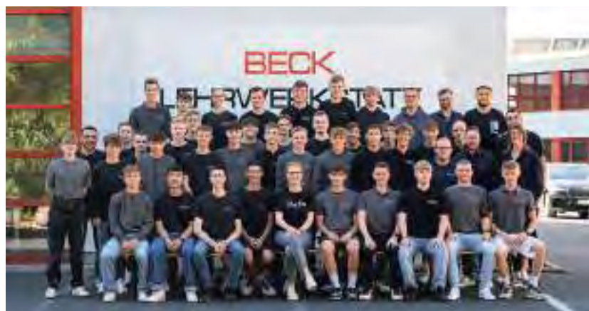
Team Elektro Beck bildet Elektroniker in drei Fachrichtungen aus.

Mitarbeiterinnen und Mitarbeiter zu machen. Das belohnt das Unternehmen. Wer nach der Ausbildung bleiben möchte, der hat beste Möglichkeiten, vom Azubi zum Jung-Monteur oder zur Jung-Monteurin zu werden: Das Team Elektro Beck verspricht hohe Übernahmechancen.