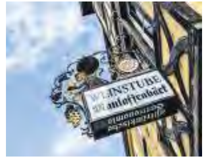
Der „Bäck“ ist eine Sonderform klassischer Weinstuben in Würzburg.