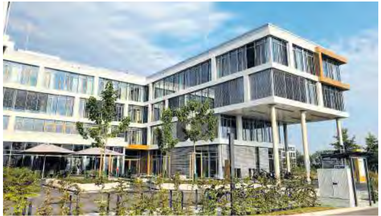
Ein Gebäude des Zentrums für Digitale Innovationen (ZDI) Mainfranken

Weitere hilfreiche Einrichtungen sind das Technologie- und Gründerzentrum Würzburg (TGZ) und der Vogel