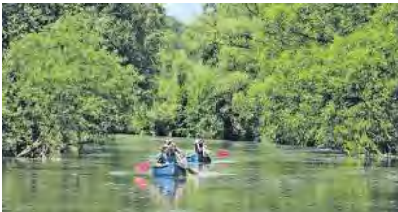
Sport im Freien – für viele Kinder ein Erlebnis

Viele unserer Mitarbeitenden können ihr Hobby während ihrer Arbeitszeit ausüben – gemeinsam mit Kindern und Jugendlichen spielen sie Fußball oder Basketball, malen oder stricken sie, kochen, schmücken, basteln oder machen Musik. Egal was du vorher gemacht hast – wir, das sind weit über 1000 Menschen, schauen gemeinsam in eine spannende Zukunft mit einem Ziel: Wir geben keinen auf!