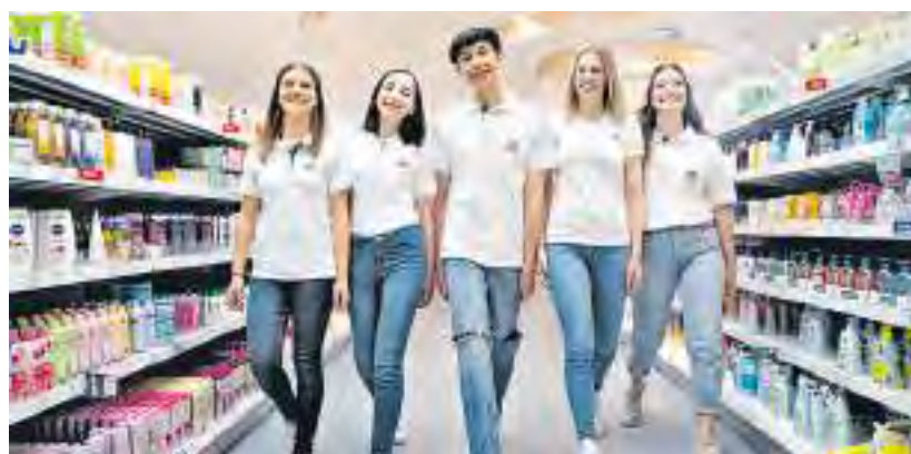
Lernen bedeutet bei dm, sich stetig weiterzuentwickeln.

Dann sollten wir uns unbedingt kennenlernen!