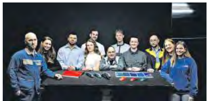
Das Team von BASF Coatings in Würzburg

den in den Bereichen Labor, Produktion, Anwendungstechnik, Supply Chain, Logistik sowie Technical Site Services bieten maßgeschneiderte Lösungen termingerecht in hoher Qualität. BASF Coatings investiert aktuell in eine erhebliche Kapazitätserweiterung in Würzburg. Mit dem moderneren digitalisierten Fertigungsprozess wird in Zukunft noch nachhaltiger ressourcenschonend produziert und die Effizienz gesteigert. Mit ihren neuen Technologien leistet BASF Coatings einen weiteren Beitrag zum Ziel der BASF-Gruppe, bis 2050 Netto-Null-CO 2 -Emissionen zu erreichen.