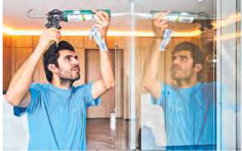
Die Handwerkskammer berät und begleitet Betriebe, die Fachkräfte aus dem Ausland beschäftigen möchten.

Die HWK berät und begleitet Betriebe, die Fachkräfte aus dem Ausland beschäftigen möchten, ebenso wie Fachkräfte mit im Ausland erworbenen Berufsqualifikationen, die im unterfränkischen Handwerk Fuß