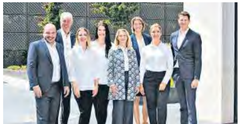
Ruppert Immobilien berät Sie gerne.

Die langjährige Firmengeschichte von Ruppert Immobilien seit 1985, die bereits in zweiter Generation fortgeschrieben wird, belegt das eindrucksvoll.