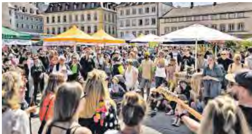
Zukunftsfest auf dem Unteren Markt in Würzburg

Zahlreiche Auszeichnungen bestätigen das Engagement des Unternehmens, das mit seinem Onlineshop memo.de ein breites, nachhaltiges Sortiment von Büroartikeln, Lebensmitteln über Möbel bis hin zu Haushaltsartikeln anbietet. Alle Produkte sind gezielt nach strengen ökologischen und sozialen Kriterien ausgewählt, viele davon tragen anerkannte Umweltzeichen und Labels, wie beispielsweise den Blauen Engel.