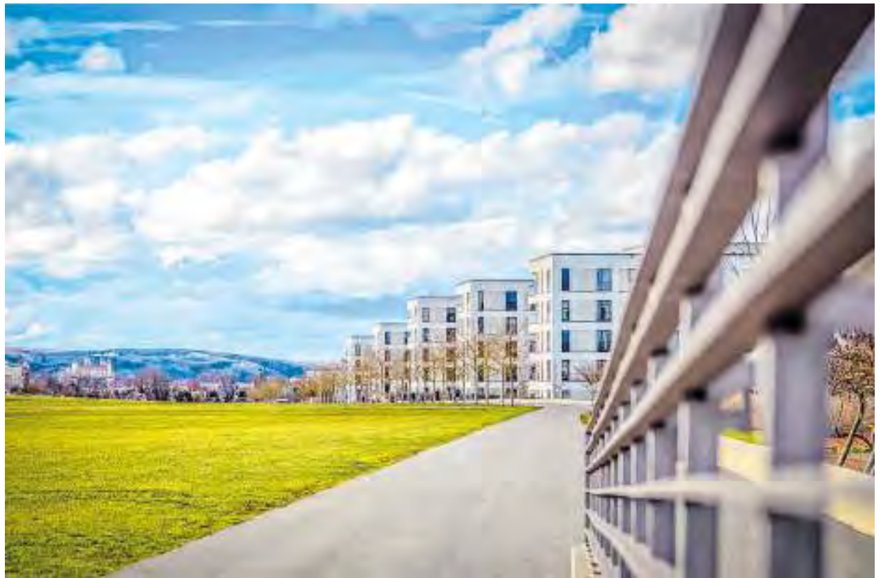
Blick auf die Festung Marienberg vom Belvedere im Stadtteil Hubland aus

Aktuelle Daten zeigen eine stabile Beschäftigungslage in der Region. Die Arbeitslosenquote lag im April 2024 in der Stadt bei 4,1 Prozent, im Würzburger Landkreis bei 2,5 Prozent – und damit jeweils deutlich unter dem Bundesdurchschnitt von 6,0 Prozent. Dies spiegelt nicht zuletzt die wirtschaftliche Stabilität und die hohe Attraktivität des Standorts für Unternehmen wider. Insgesamt präsentiert sich Würzburg