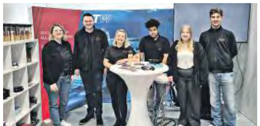
ITW Motion in Röttingen pflegt ein familiäres Betriebsklima.

Wie genau? Lernt uns als Arbeitgeber kennen und erfahrt mehr über unsere Ausbildungs- Studien- und Praktika-Angebote!