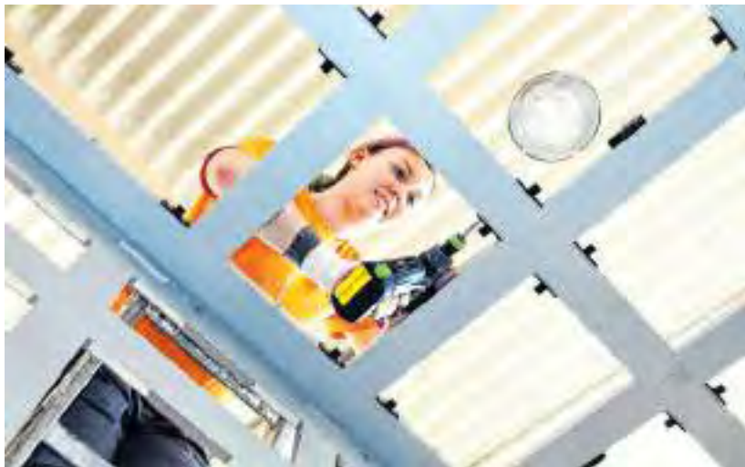
Die Bereiche Bau und Ausbau, die zusammen knapp die Hälfte aller unterfränkischen Handwerksbetriebe ausmachen, sind nach einem Dämpfer im 4. Quartal 2023 wieder in den Konjunkturdurchschnitt zurückgekehrt.

Für das anstehende zweite Quartal des Jahres rechnen 84,6 Prozent der Betriebe mit einer verbesserten oder gleichbleibenden Geschäftslage. „Das sind deutlich bessere Werte als die im Vorquartal“, so Paul. Die Gründe für die doch positiven Konjunkturwerte sieht er vor allem in der nachhaltigen Ausrichtung der Handwerksbetriebe und im unternehmerischen Optimismus. „Sicherlich belasten überbordende Bürokratie mit