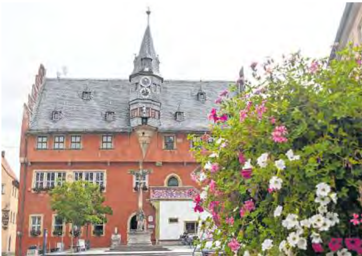
Das Ochsenfurter Rathaus

Die Zahl der Rad- und Wanderwege sowie E-Bike-Ladestationen wurde erheblich ausgebaut. Gastronomie und Handel stellen sich hierauf ein. Neue Badestellen am Mainufer entstanden, das Freizeitgelände am Erlabrunner Badeseesee wurde weiterentwickelt und neue Pläne für den Guttenberger Forst angestoßen. Der Aufbau von gemeinde- und teilweise auch landkreisübergreifenden Allianzen kam auch dem Tourismus in den betreffenden Regionen zugute. Insgesamt ist der Landkreis Würzburg mit seiner starken Wirtschaft, seiner lebendigen Kultur, seiner attraktiven Lebensqualität und seinen vielfältigen Freizeitmöglichkeiten ein Ort, der alle Facetten für ein erfülltes Leben vereint. Ob als Unternehme-