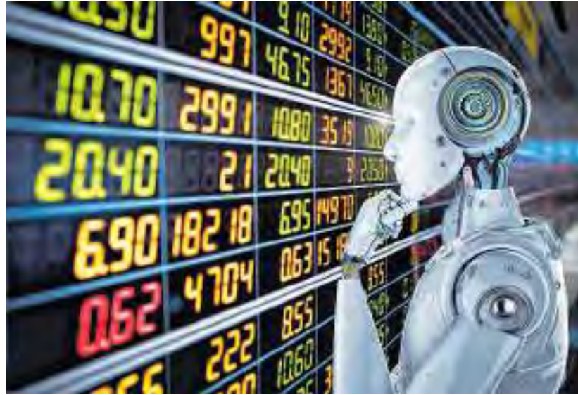
Künstliche Intelligenz (Symbolbild)

Bei Kleinunternehmen mit bis zu neun Mitarbeitern sind es sogar 40 Prozent. Im Vergleich zum Vorjahr ist hier ein deutlicher Schub durch den Hype rund um Anwendungen wie zum Beispiel ChatGPT zu verzeichnen: Besonders beliebt ist KI bei der Erzeugung von Texten, Bildern und Audios sowie in der personalisierten Kundenansprache.