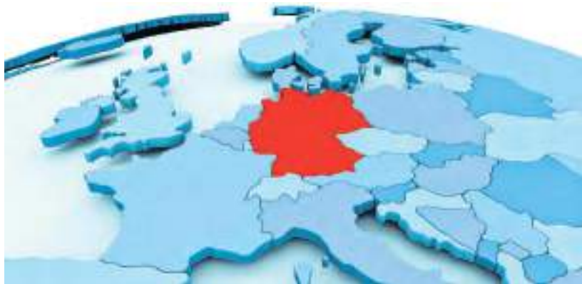
174 Staaten listet der Stateness Index auf, 94 von ihnen gelten in unterschiedlichen Ausmaßen als defekt.