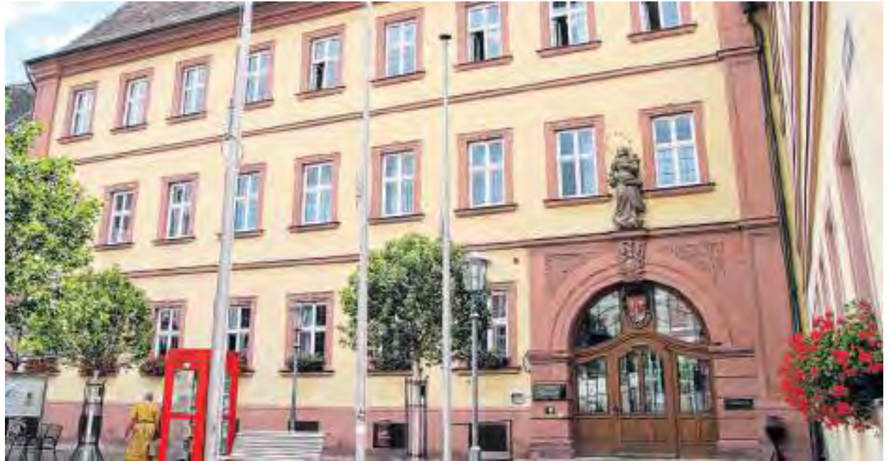
Das Landratsamt Main-Spessart in Karlstadt

Doch seit Jahrzehnten bewährt sich der Landkreis zudem als kompetenter Technologie-Standort mit hoher Wertschöpfung. Main-Spessart ist heute industriestärkster Landkreis in Unterfranken und zeichnet sich durch ein breites Branchenspektrum vom klassischen Maschinenbau