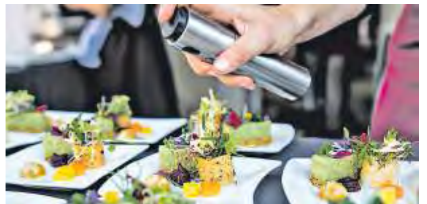
Tast of Franken, ein unvergessliches kulinarisches Erlebnis

Sichern Sie sich jetzt Ihre Tickets und seien Sie dabei, wenn das Gut am 7. Juni zu Taste of Franken seine Tore öffnet. Ein Abend voller Genuss und Geselligkeit erwartet Sie!