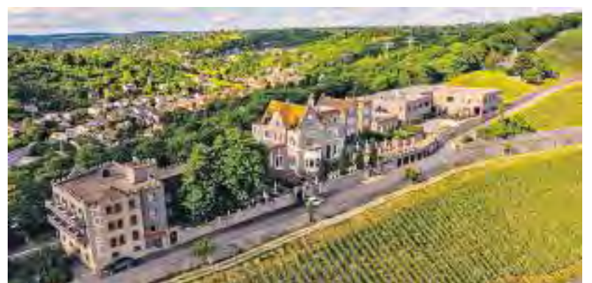
Schlosshotel Steinburg: Tagung und Genuss in stilvollem Ambiente

Pausenbuffets an und kocht mittags frische leichte Gerichte. Für das besondere Event-Erlebnis am Abend sorgt ein Do-it-yourself-BBQ bei besten Aussichten für lockere Atmosphäre und regen Austausch. Eine weitere Attraktion ist der haus-eigene Weinkeller „SteinReich“. Hier warten bei Rahmenprogrammen neben internationalen Weinen die besten Lesen Frankens auf ihre Verkostung. Übernachtungsgäste genießen in insgesamt 69 Zimmern und Juniorsuiten eine Mischung aus klassischer Eleganz, mediterranem Lebensgefühl und moderner Klarheit.