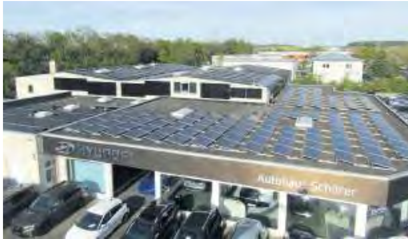
Das Dach des Autohauses Schürer ist vollständig mit einer Photovoltaik-Anlage bebaut, die jährlich rund 461.000 kWh Strom produziert.

Wie Umweltbewusstsein und Nachhaltigkeit in einem Autohaus funktionieren, macht das Autohaus Schürer in Würzburg vor. Und profitiert davon. Seit der Inbetriebnahme der Photovoltaik-Anlage auf dem Dach des Autohauses im Juli 2019 bis heute hat der Hyundai- und Subaru-Händler in der Nürnbergerstraße rund 461.000 Kilowattstunden (kWh) Strom produziert. Das entspricht einer Jahresleistung von 100.000 kWh. Davon wurden 50 Prozent ins Netz der Mainfranken-netzwerke eingespeist. Dazu ließ Schürer auch einen Elektrospeicher installieren, der vollgeladen Strom zur Verfügung stellt, wenn die Sonne nicht scheint.