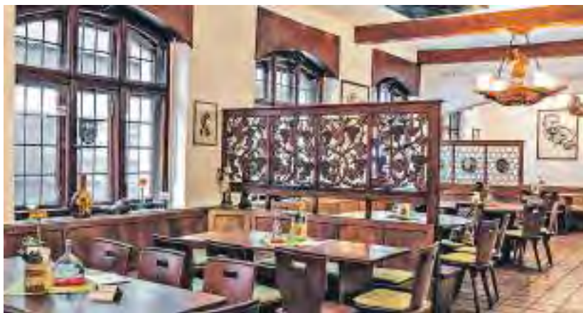
Trinken und speisen im Maulaffenbäck

Als Maulaffen bezeichnete man Kienspanhalter aus Ton, in die man Kienspäne steckte und zur Beleuchtung anzündete. Im Niederdeutschen nannte man das „Mulape“, übersetzt „Maul offen“ – Maulaffe. Da offenbar ein früherer Bäcker im heutigen Maulaffenbäck oft vor Erstaunen mit offenem Mund am Türpfosten lehnte und er dabei so aussah wie ein Kienspanhalter, wurde er von vorbeilaufenden Studenten scherzhaft als Maulaffe bezeichnet, wie Andreas Kern sagt.