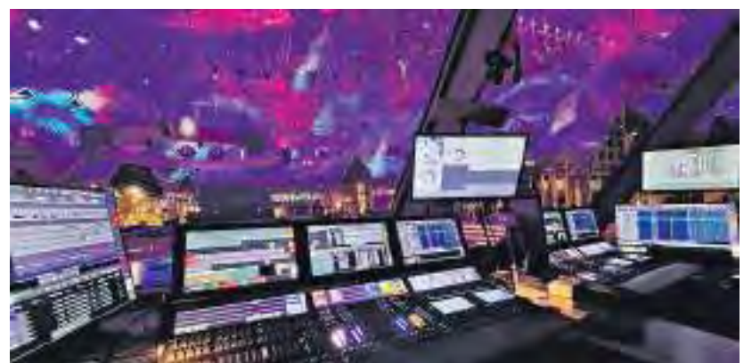
MA Lighting kreiert Licht für: Theater, Fernsehshows, Kirchen, Konzerte.

te Atmosphäre oder Beleuchtungsszene zu erzeugen. Moderne Lichtstellpulte bieten eine Vielzahl von Funktionen und können komplexe Lichtshows mit einer großen Anzahl von Scheinwerfern und Effekten programmieren und abspielen. MA Lighting genießt seine Spitzenposition in der Unterhaltungsindustrie dank zweier starker Standbeine – in Waldbüttelbrunn und in Paderborn. Zusammen bilden sie das Fundament, auf dem MA Lighting seine Visionen von Licht und Technologie in die Tat umsetzt und weltweit Maßstäbe in der Branche setzt.