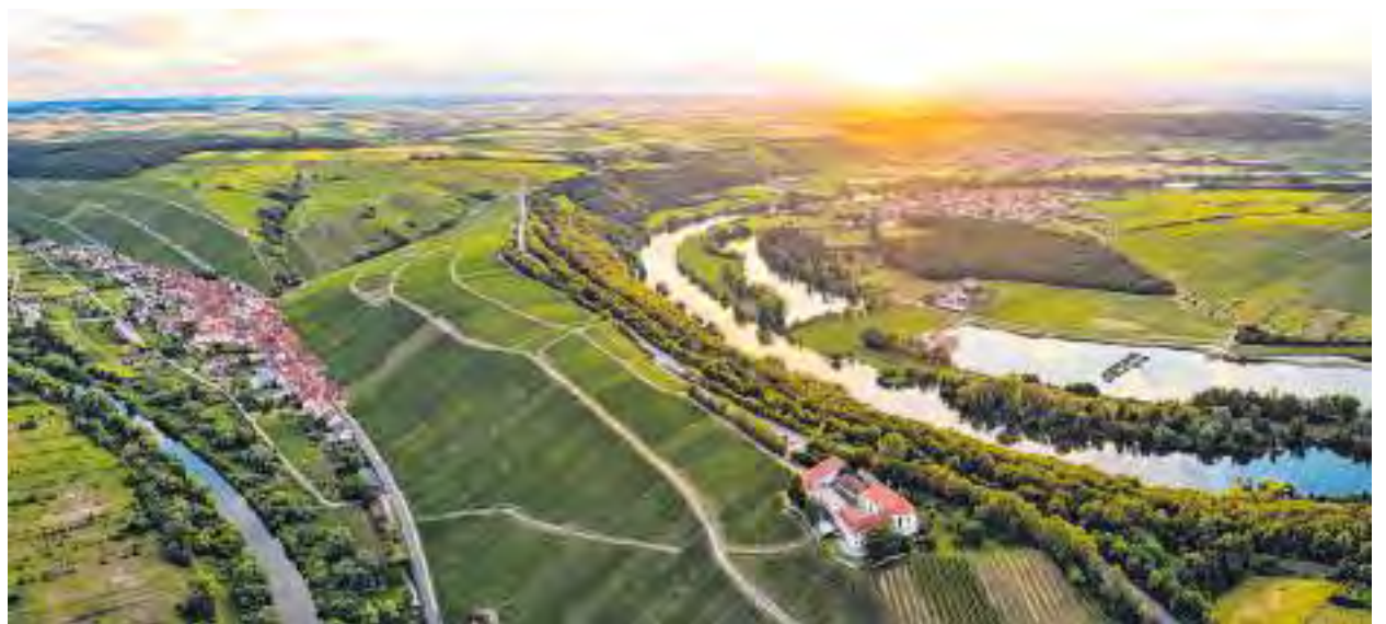
Blick auf die Mainschleife bei Volkach

Ob nach Würzburg über die Bundesstraße B8, nach Bamberg über die Bundesstraße B22 oder nach