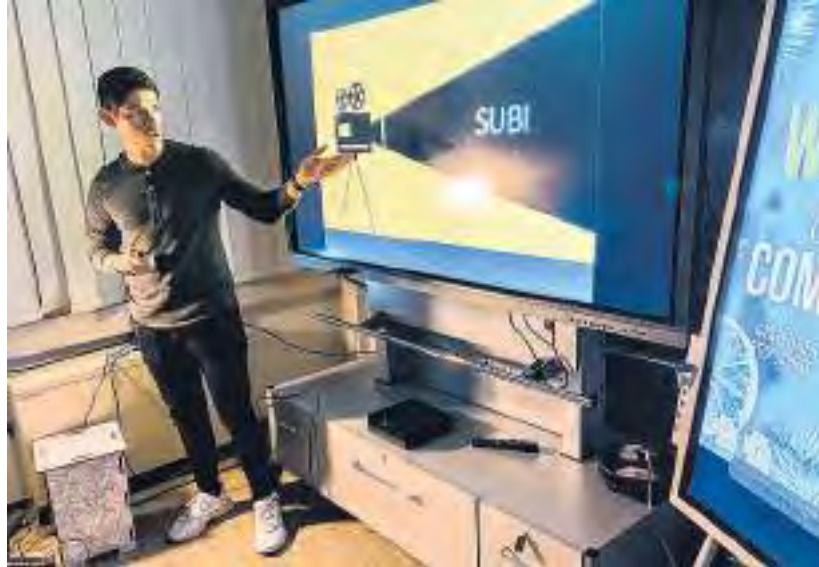
Der KickStart-Wettbewerb wird vom Bundesministerium für Bildung und Forschung finanziert. Illustration: Katharina Pfeuffer, THWS

Bewerbungen sind als Einzelperson und auch als Team möglich. Ausgerichtet wird der Wettbewerb vom Startup-Lab Werk:Raum in Kooperation mit dem Projektträger VDI Technologiezentrum, der letztlich über die Förderfähigkeit der einzelnen Ideen bestimmt. Der Vorentscheid findet im Rahmen einer sogenannten Pitch-Veranstaltung statt. Nach dieser Vorauswahl entscheiden der Projektträger und