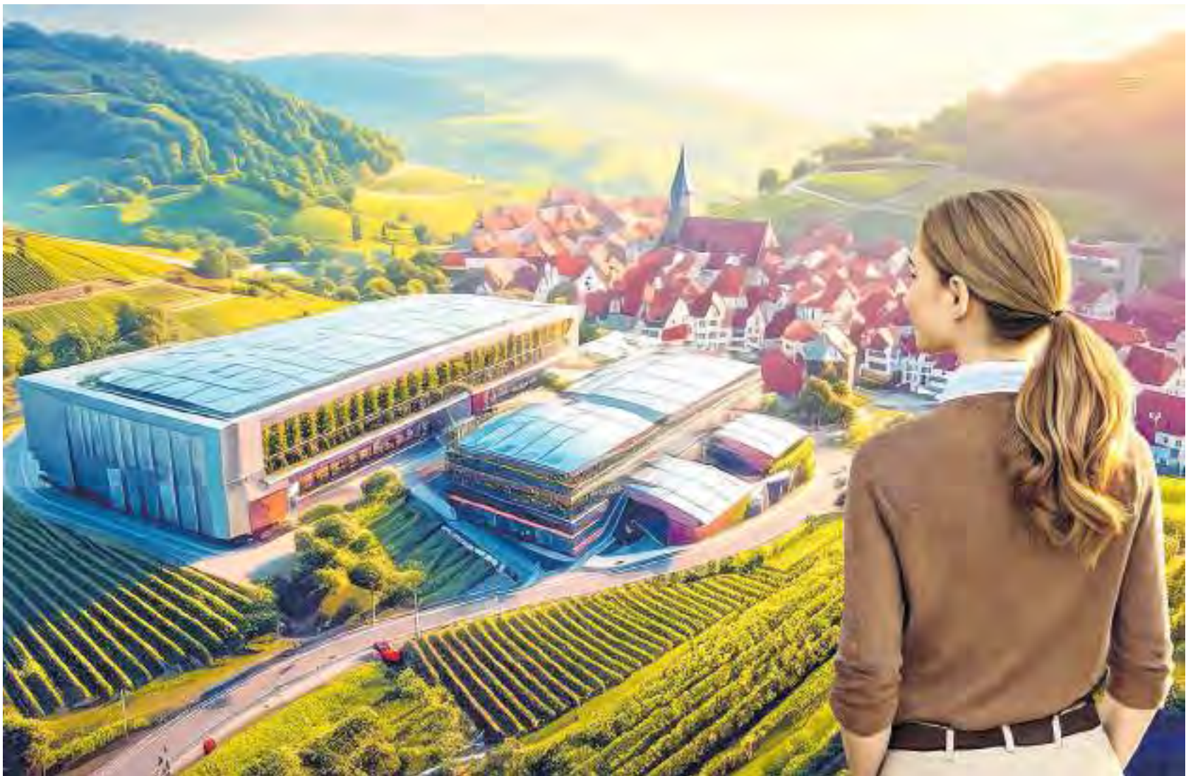
Der Blick – hier durch die KI-Brille – auf die mainfränkische Wirtschaft zeigt lokale Helden in Dienstleistung, Handwerk, Handel und Produktion.