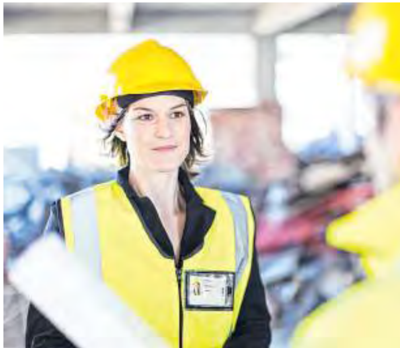
Frauen auf der Baustelle – für jüngere Menschen ist das heutzutage nichts Ungewöhnliches mehr.

„Viele Bauleiter dort haben selbst erst vor wenigen Jahren ihren Abschluss gemacht. Dadurch waren wir gleich auf einer Wellenlänge. Als ich das erste Mal dort gearbeitet habe, war außerdem auch eine weitere Studentin, die gerade ihr Praxissemester absolviert hat, im Büro. Bei den älteren Maurern oder Vorarbeitern gab es ab und zu allerdings doch schiefe Blicke“, sagt sie rückblickend.