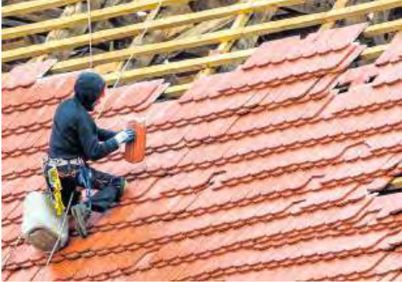
Das Handwerk – hier verdeutlicht durch einen Dachdecker – setzt die Wünsche der Kunden und Kundinnen flexibel und kreativ um.