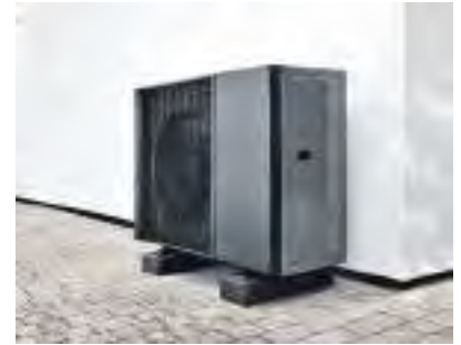
Der Staat zahlt für Wärmepumpen 2024 eine satte Förderung.

Außerhalb der guten Fördermöglichkeiten ist auch eine Preisanpassung von Wärmepumpen und Biomasseanlagen am Markt sichtbar. „Die Lager sind gefüllt mit diesen