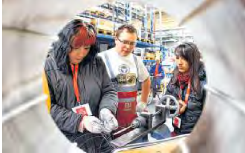
Beim „Girls'Day“ bekommen Mädchen Einblicke in Berufe, die unverändert dominiert von Männern sind.