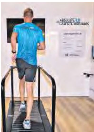
Vor dem Kauf: Lauftechnikanalyse auf dem Laufband

Wer gerne in Gemeinschaft läuft oder Tipps zum individuell besten Laufstil benötigt, trifft sich mit Gleichgesinnten jeweils mittwochs um 18.30 Uhr zum Community Run. Einsteiger und Profis finden sich dann vor dem Geschäft ein und drehen eine Joggingrunde. Im Anschluss wartet ein kostenloses, alkoholfreies Weißbier auf die Aktiven.