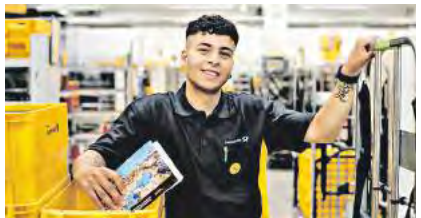
Die Post steht für eine vielfältige und gleichberechtigte Kultur.

Die Niederlassung Würzburg betreut ein Gebiet von Würzburg bis Bamberg und von Bad Kissingen bis Bad Mergentheim mit einem Paketzentrum, drei Paketzustellbasen und zwei Briefzentren.