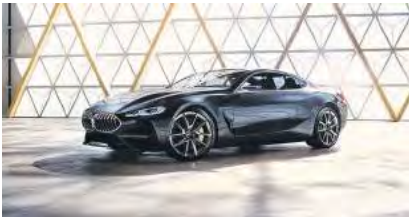
Mit Kraft und Eleganz in die Zukunft: das neue BMW 8er Coupé

nehmensziele bei. Mitarbeitern bieten sich Karriereöglichkeiten und Arbeitsaufgaben im Rahmen ihrer Wünsche, Fähigkeiten und Talente. Der BMW-Autohändler ist bestrebt, seine Mitarbeiter dabei zu unterstützen, ihr Potenzial zu entfalten. Darüber hinaus legt das Unternehmen großen Wert auf die Gesundheit und das Wohlbefinden der Mitarbeiter. Davon zeugt eine Vielzahl von Sozialleistungen, wie zum Beispiel flexible Arbeitszeiten, betriebliche Altersvorsorge und Mitarbeitervergünstigungen.