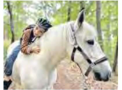
Tiergestützte Therapie als wichtiger Pfeiler der Jugendarbeit

Vielfalt, Freude, Leistung – das bieten und erwarten wir von unseren Mitarbeitenden. Werde Teil unseres Teams und kümmere dich um das Herzstück unserer Einrichtung – unsere Kinder und Jugendlichen. Du interessierst dich für Erlebnis-