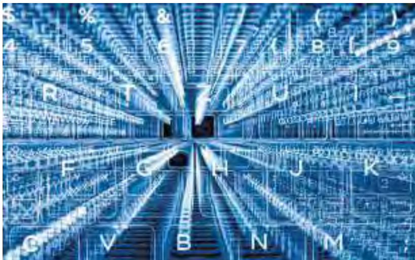
Künstliche Intelligenz (Symbolbild) ist eine Schlüsseltechnologie mit Wachstumspotenzial.