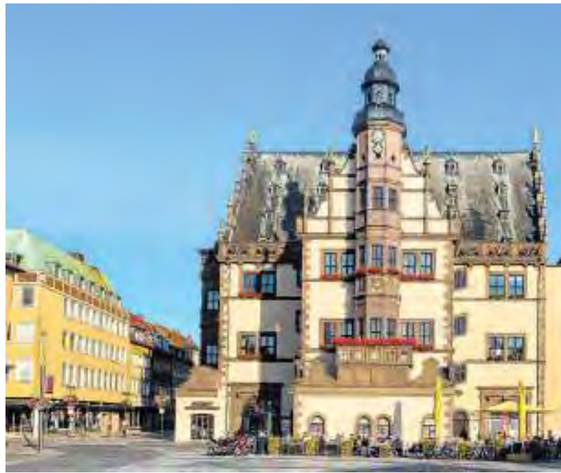
Das Schweinfurter Rathaus

Im Teilprojekt „KunstFABrik“ wird ein Leerstand über die Dauer von zwei Jahren durch die Stadt Schweinfurt