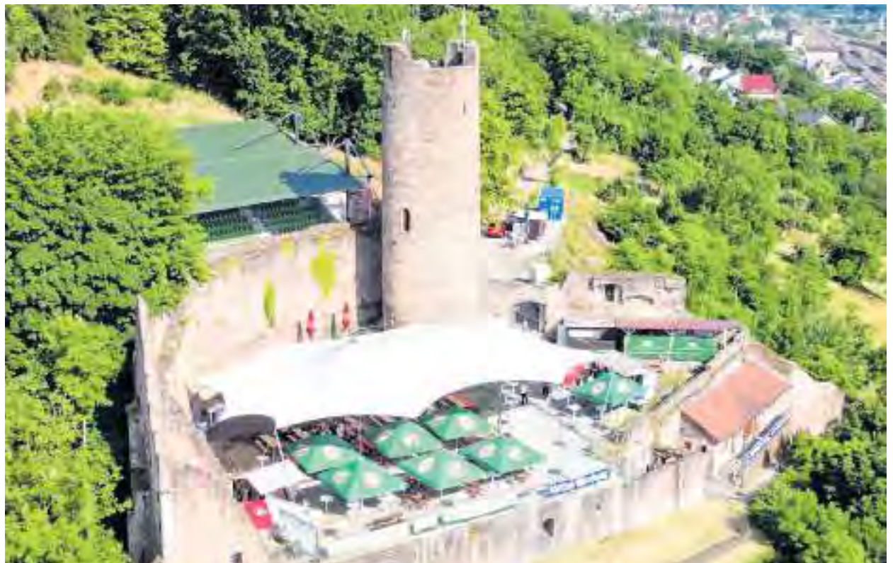
Die Scherenburg hoch über Gemünden

Um die Attraktivität des Landkreises auch für junge Menschen zu erhöhen, wird der Pressemitteilung zufolge aktuell ein Technologietransferzentrum (TTZ) mit dem Schwerpunkt „Nachhaltige digitale und additive Produktion“ in Marktheidenfeld auf-