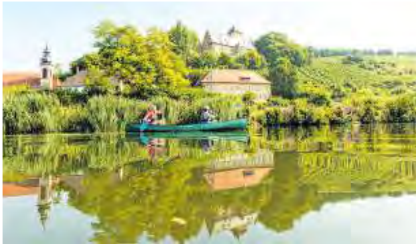
Der Landkreis Schweinfurt hat eine landschaftliche Vielfalt – hier zu sehen sind der Main und Schloss Mainberg – zu bieten.

Ein großes Potential bietet die, durch den Abzug der US-Armee freigewordene, über 200 Hektar große Fläche der ehemaligen Kaserne Conn Barracks. Ziel ist es, die verkehrsgünstig gelegene Fläche zu