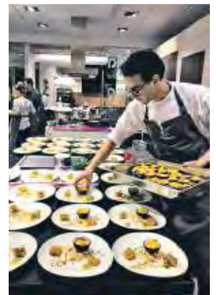
Kochkurse und Events kommen bei den Kunden sehr gut an.

Die Inhaber teilen sich Aufgaben im Vertrieb, Marketing und technischer Unterstützung auf. Die enge Zusammenarbeit mit der Franchise-Zentrale in Böblingen ermöglicht