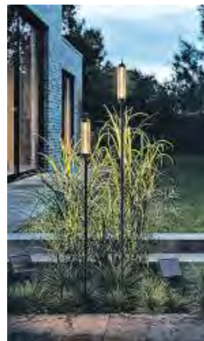
Licht schafft Atmosphäre und ruft Gefühle hervor.

ist meist langfristig. Und über diese langfristigen guten Beziehungen freut sich das Unternehmen und ist auch etwas stolz darauf, denn sie schaffen Vertrauen und sind der Grundstein für noch viele Aufgaben rund ums Licht.