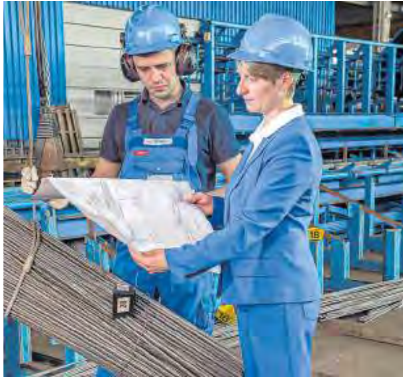
Der Landkreis Schweinfurt ist nicht nur stark in der Industrie (Symbolbild), sondern weist einen vielfältigen Branchenmix auf.

Die verkehrsgünstige Lage gibt dem Landkreis Schweinfurt wichtige Impulse als Wirtschaftsstandort. Direkt durch das Kreisgebiet führt mit der A7 eine der wichtigen Nord-Süd-Verbindungen, im Süden verläuft die A3. Die A70 stellt die Verbindung zur Autobahn nach Berlin her und durch den Ausbau der A71 hat sich die Verbindung in die Bundesländer im Osten erheblich verbessert.