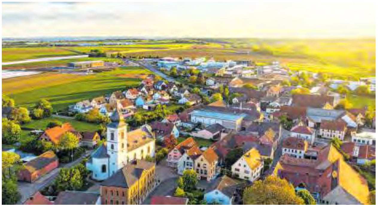
Knapp 62.000 Hektar groß ist die landwirtschaftlich genutzte Fläche im Landkreis Würzburg. Mit viel Liebe, Sorgfalt und unermüdlicher Arbeit holen die Landwirtinnen und Landwirte das Beste aus den ertragreichen Böden heraus. Kraut und Gurken gehören schon lange in den Norden von Würzburg. Im Bild: Unterpleichfeld.

Gerade das Koordinieren der unterschiedlichen Projekte ist von großer Bedeutung, schließlich gibt es zahlreiche Initiativen, die regionale und auf eine bestimmte Zielgruppe zugeschnittene Lösungen anbieten. Sie alle an einem Tisch zusammenzubringen und damit die Attraktivität, Wirkungs- und Handlungsmöglichkeit des Kreises im Ganzen zu erhöhen, das ist eine der Aufgaben der Kreisentwicklung. Der Landkreis Würzburg mit seiner einzigartigen Mischung aus leb-