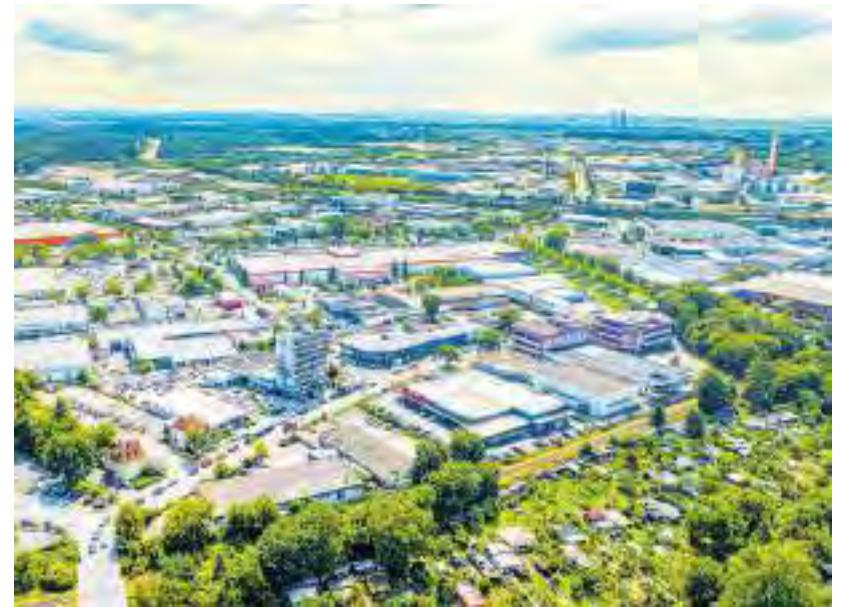
Im Industriegebiet Schweinfurter Hafen haben sich viele Unternehmen angesiedelt.