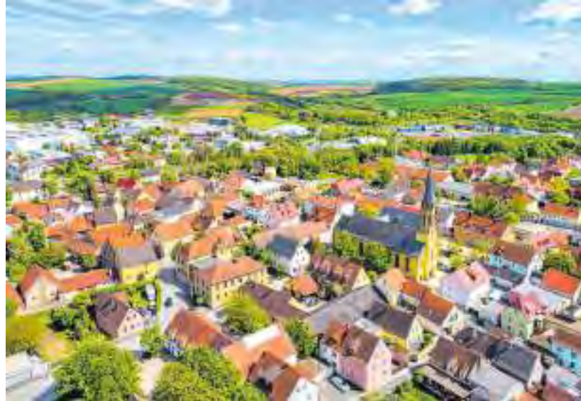
Der Landkreis Würzburg mit seiner Mischung aus lebhaften Städten sowie Gemeinden und ländlicher Idylle bietet Bürgerinnen und Bürgern sowie Unternehmen eine optimale Lebens- und Arbeitsqualität. Im Bild: Rottendorf.

Die geographische Lage, eingebettet in die Metropolregionen Nürnberg, Frankfurt und Stuttgart, ist ein bedeutender Faktor für den Erfolg. Die Nähe zu diesen Wirtschaftszentren bietet Unternehmen im Landkreis Würzburg Zugang zu einem breiten Markt und eröffnet internationale Möglichkeiten für Exporte und Kooperationen.