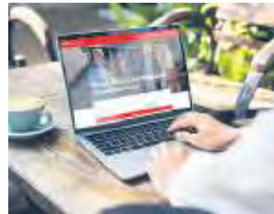
Das neue Karrierecenter von XXXLutz unter karriere.xxxlutz.de

In einem dynamischen und wachsenden Unternehmen finden potenzielle Mitarbeitende ideale Bedingungen für einen vielversprechenden Einstieg. Allein im vorigen Jahr wuchs die Deutschlandzentrale von XXXLutz auf dem Würzburger Heuchelhof um rund 3000 Quadratmeter und schuf damit 300 neue Arbeitsplätze. Somit arbeiten rund 700 Menschen dort in einem Umfeld, dem es an nichts fehlt, was ein moderner Arbeitsplatz heute bieten kann: Großraumbüros gemäß dem Desk-Sharing-Konzept, eine firmeneigene Kantine, begrünte Außenbereiche und Chillout-Areas sorgen für ein Wohlfühlflair während der Arbeitszeit und in den Pausen. Ein nachhaltiges Ambiente ergänzt den modernen Arbeitsplatz: eine Photovoltaikanlage,