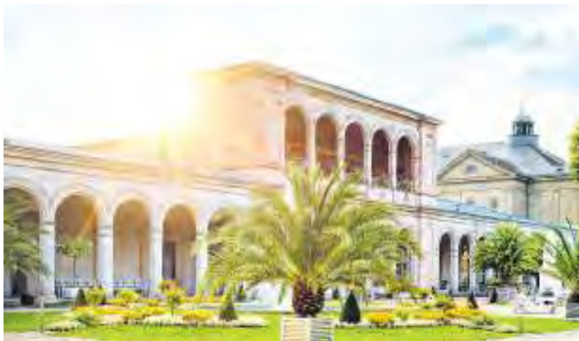
Der Arkadenbau in Bad Kissingen

Das Bayerische Staatsbad Bad Kissingen ist Deutschlands bekanntester Kurort und seit 2021 Teil des Unesco-Weltkulturerbes „Great Spa Towns of Europe“, also „bedeutende Kurstädte Europas“. Die Welterbestätte besteht laut einer Pressemitteilung der Stadt Bad Kissingen aus insgesamt elf historischen und weltberühmten Kurstädten in sieben Ländern, die das Phänomen der europäischen Kur auf besondere Art und Weise verkörpern. Bad Kissingen gilt hier als das Musterbad für die Zeitstellung des beginnenden 20. Jahrhunderts. So befindet sich in Bad Kissingen Europas größtes zusammenhängendes Kurensemble – bestehend aus dem Regentenbau mit dem Arkadenbau sowie der Brunnen- und Wandelhalle. Der Tourismus, das Baugewerbe sowie die Branchen Medizintechnik und Gesundheit bestimmen den Wirtschaftsstandort Bad Kissingen. Die Mittelstadt mit 23.500 Einwohnerinnen sowie Einwohnern und acht Stadtteilen liegt strategisch günstig an den Autobahnen A7, A70 und A71