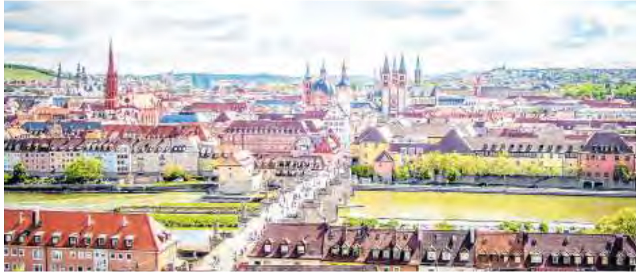
Blick von der Festung Marienberg auf die Würzburger Innenstadt

Beim Einzelhandel zeichnet sich die Stadt durch einen gesunden Mix aus: Filialisten gesellen sich zu inhabergeführten Läden, großflächige Betriebe agieren erfolgreich neben kleinteiligeren Fachgeschäften. Hinzu kommt ein stabiler, gewachsener Bestand an Gewerbetreibenden und Handwerksbetrieben aller Art. Auch an Kundschaft mangelt es nicht: Die über 280.000 Einwohnerinnen und Einwohner aus Stadt und Landkreis bilden eine breite lokale Basis an Konsumentinnen und Konsumenten. Zudem gibt es im Würzburger Raum eine ganze Reihe von Unternehmen, deren Versorgungsleistungen und Handelsbeziehungen weit über die Region hinaus reichen, beispielsweise in der Modebranche, bei der Aus-