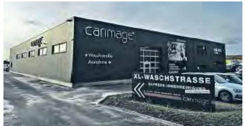
XL-Waschstraße von Carimage in Würzburg

Farbmischung nach Farbscan des Tankdeckels anzusetzen. Auf diese Weise werden auch kaum wahrnehmbare Farbveränderungen berücksichtigt. Kurios: Vor allem Frauen werden bei der Entwicklung und Anmischung von Farben eingesetzt, da sie über eine bessere Farbwahrnehmung verfügen als Männer und selbst feinste Nuancen besser erkennen können. Eine moderne Waschstraße rundet das Portfolio von Carimage ab. Sie wird übrigens auch von einer großen Zahl namhafter Würzburger Autohäuser genutzt.