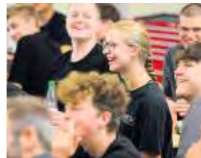
Tarifliche Bezahlung und ein gutes Arbeitsklima

Team Elektro Beck aus Würzburg sucht neue Azubis und bietet ihnen die Chance, an der Energiewende mitzuarbeiten. Und die steigen in ein Team ein, das vielseitig aufgestellt ist. Hier erfahren Auszubildende Innovation, abwechslungsreiche Arbeit, tarifliche Bezahlung und arbeiten in einer eigenen Werkstatt mit Werkzeug. Mit dem digitalen Berichtsheft via App wird das Lernen außerdem zum Kinderspiel. Mit seinen 250 Mitarbeitenden ist das Team Elektro Beck ein attraktives mittelständisches Unternehmen, bei dem viele Kolleginnen und Kollegen helfen, aus Auszubildenden top ausgebildete spätere