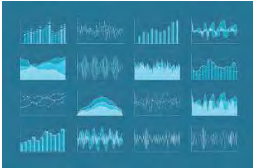
Die IHK Würzburg-Schweinfurt hat anhand einer Befragung eine Konjunkturanalyse erstellt. Das Symbolbild zeigt unterschiedliche Formen der Darstellung von Ergebnissen.