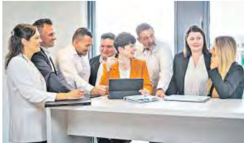
Die Agile Projektgruppe der Sparkasse Mainfranken Würzburg beim Ausarbeiten des Konzepts für das neue Gründerzentrum.

Wenn der Kapitalbedarf klar ist, kommen die Existenzgründungsberater der Sparkasse ins Spiel. Die