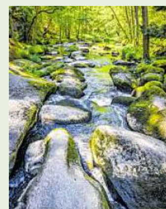
Bäche, Flüsse, Seen, Teiche – die Wasserlandschaften im Oberpfälzer Wald sind vielfältig.

In der Region an der bayerisch-tschechischen Grenze locken Wald, Wiesen und Wasserwelten zum naturnahen Aktivurlaub. Historische Städtchen, mittelalterliche Burgen, Teiche und das Oberpfälzer Seenland liegen auf