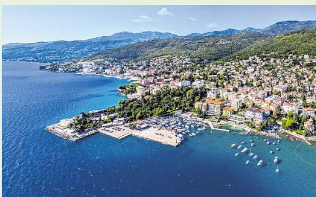
Gelegen in der Kvarner Bucht im Norden der Adria: Das Küstenstädtchen Opatija wird auch „Badewanne von Wien“ genannt.

„Opatija war der zweitgrößte Kurort der Monarchie, lediglich übertroffen von Karlsbad“, sagt Stipanić. Der Ort avancierte zum Tummelbecken der High Society, verbunden mit schmückendem Namensbeiwerk wie „Wien am Meer“, „Königin der Adria“ oder „Badewanne von Wien“. Der Zulauf begann, als Opatija ans Netz der Eisenbahn angeschlossen wurde. Historische Villen, die zwölf Kilometer lange Adriapromenade Lungomare und das Küstendenkmal „Mädchen mit der Möwe“ zählen zu den Wahrzeichen von Opatija. Stechpalmen werfen ihre Schatten auf