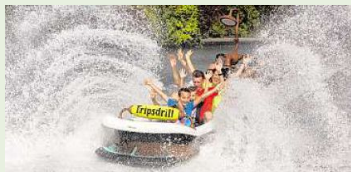
Die Badewannenfahrt zum Jungbrunnen im Erlebnispark Tripsdrill erfrischt Jung und Alt.

IHRE ANZEIGE EINFACH SELBST BUCHEN: werben.mainpost.de DIE PLATTFORM FÜR REGIONALE WERBUNG